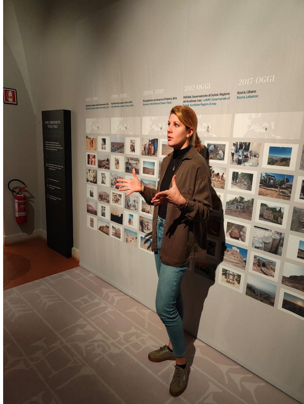
la nostra ArcheoGuida!!