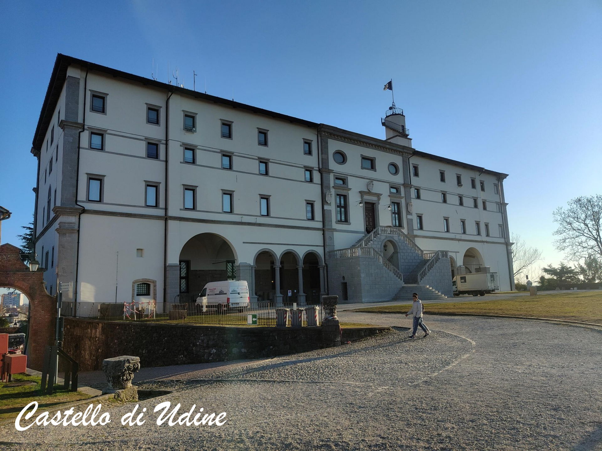
Castello di Udine