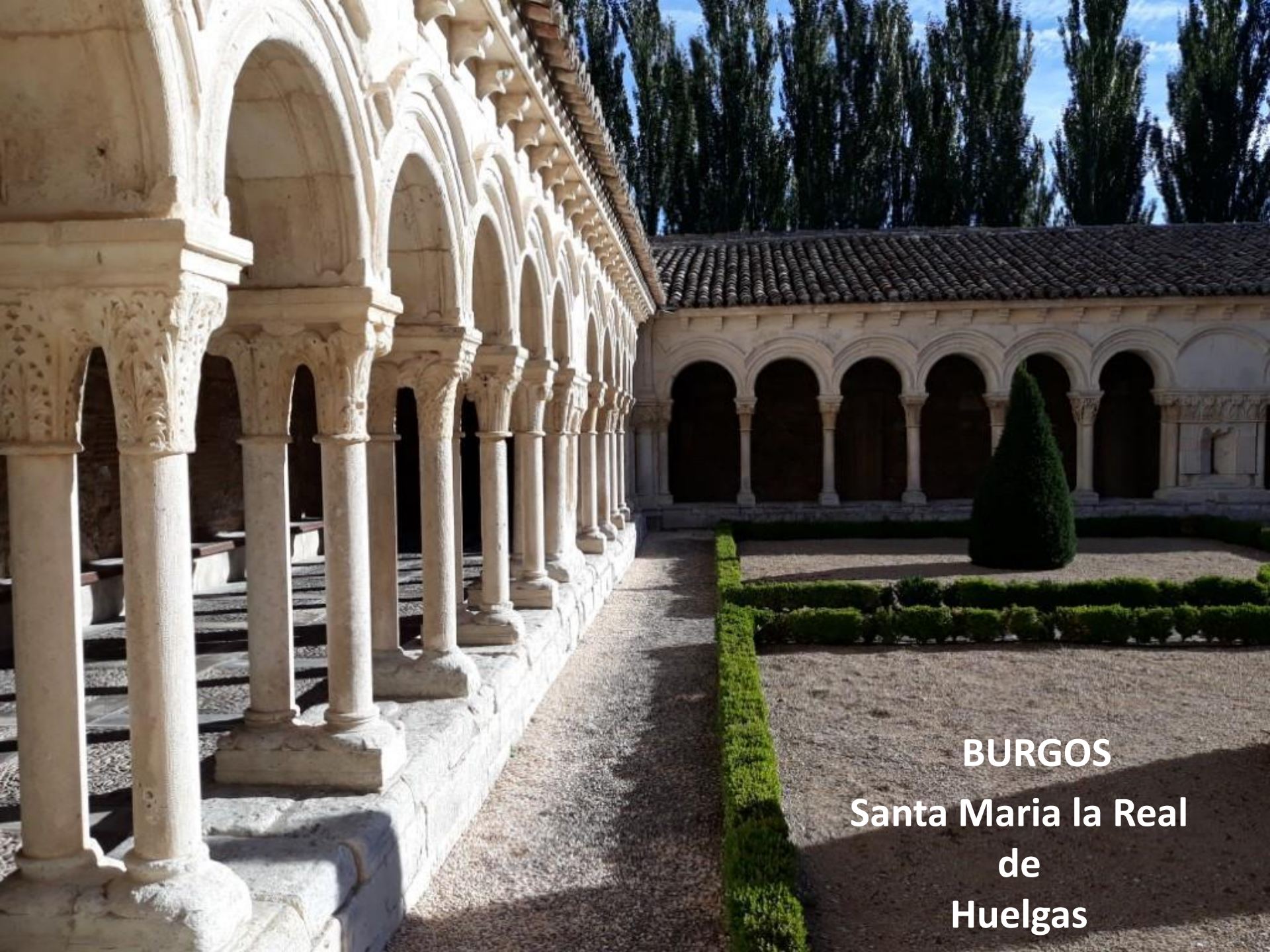
BURGOS Santa Maria la Real de Huelgas